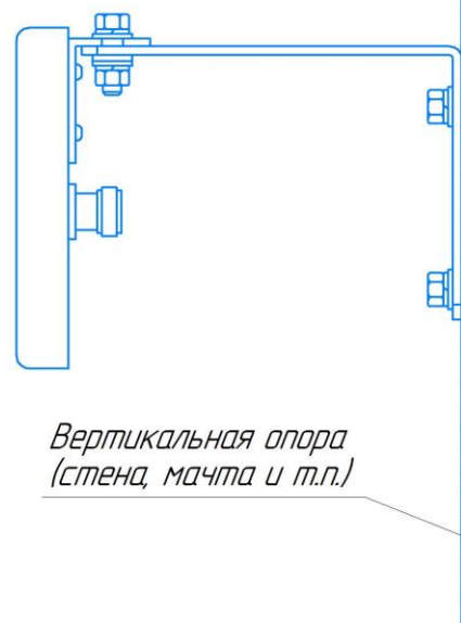
Вертикальная опора (стена, мачта и т.п.)